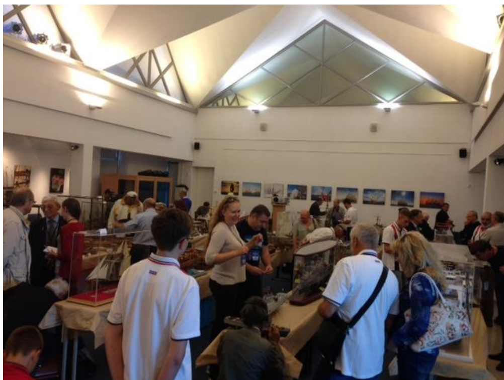
Una delle due sale che ospitano i modelli