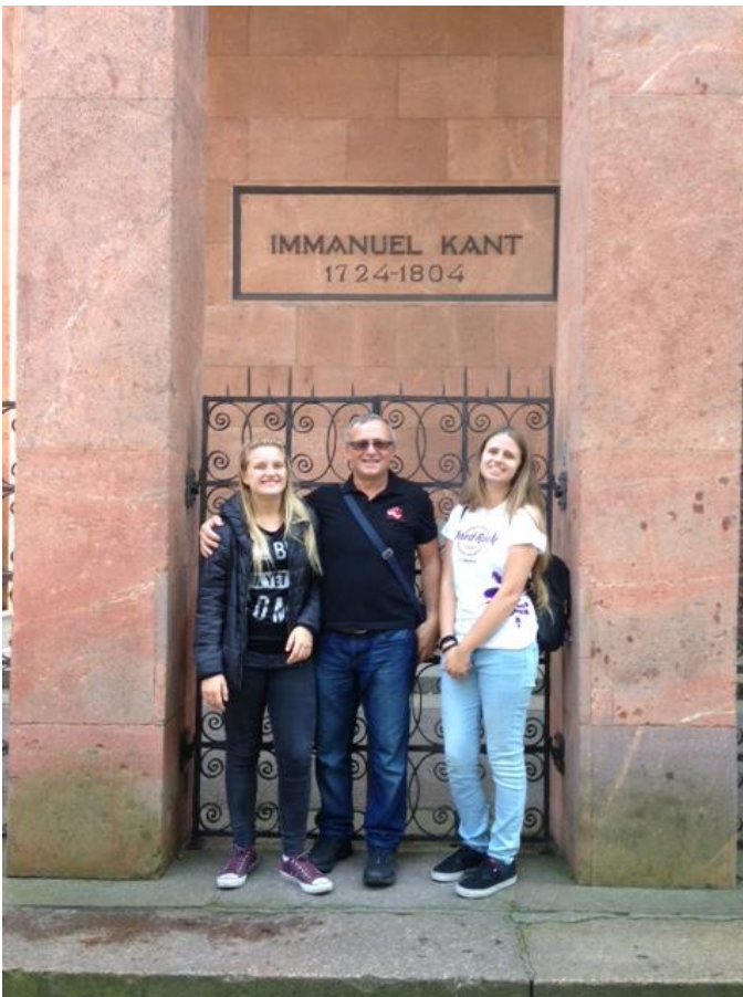
La tomba dello storico filosofo Emanuele Kant ,vicino la prestigiosa vecchia sede della Universita' Albertina (fondata nel 1544) ,e' localizzata nel verde parco dell'isolotto medioevale preservato durante la devastazione della seconda Guerra Mondiale