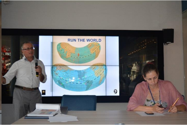
Alcune immagini del seminario su Cristoforo Colombo ed Amerigo Vespucci. Non affatto noioso!