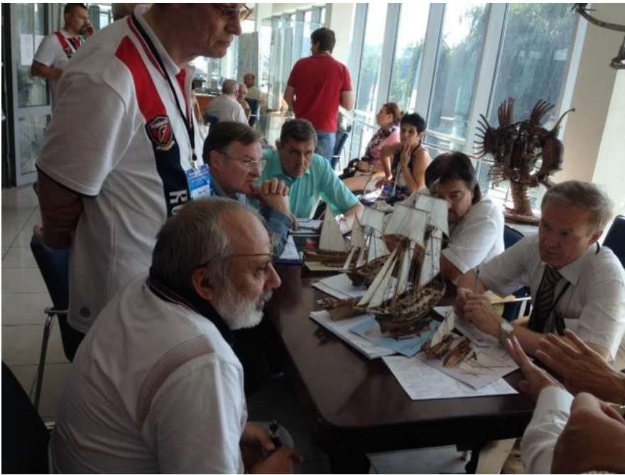
Fasi della valutazione dei modelli