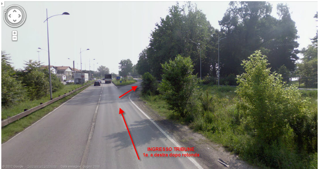
Tribuna Ovest / Via Rivoltana, Segrate, Lombardia, Italia L'indirizzo è approssimativo